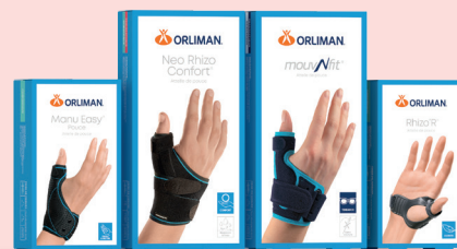
Arthrose du pouce Rhizarthrose Manu Easy® Pouce, Neo Rhizo Confort®, Mouv'N fit® Pouce, RhizoR'®.