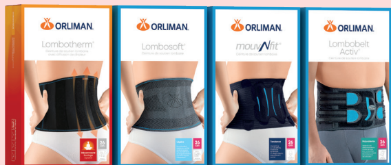
Arthrose lombaire Lombarthrose Lombotherm®, Lombosoft®, Mouv'N fit® Ceinture, Lombobelt Activ®.