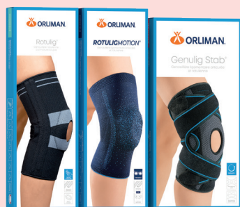
Arthrose du genou Gonarthrose Rotulig®, Rotulig Motion®, Genulig Stab®.