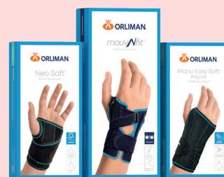
Arthrose du poignet Neo Soft®, Mouv'N fit® Poignet, Manu Easy Soft® Poignet.